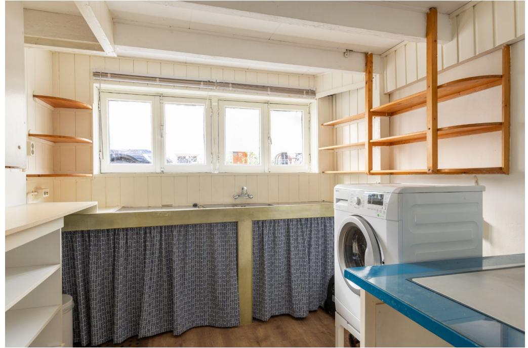
Bijkeuken Bijkeuken beschikt over een wasmachineaansluiting.