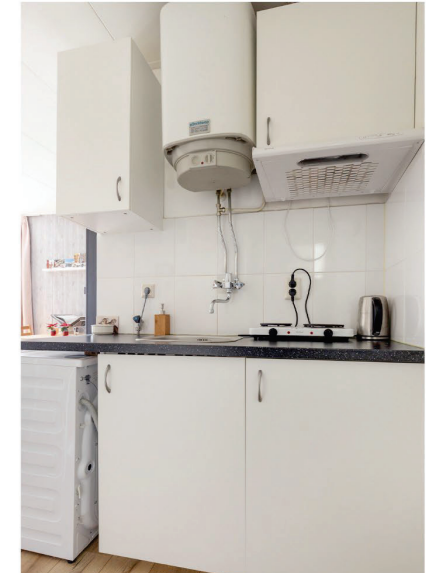
Keuken De keuken is voorzien van een 2-pits gasfornuis met een afzuigkap, een combinatie koelkast en vriezer en een wasmachine-aansluiting.